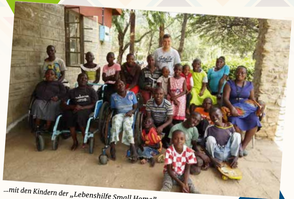
...mit den Kindern der „Lebenshilfe Small Home“