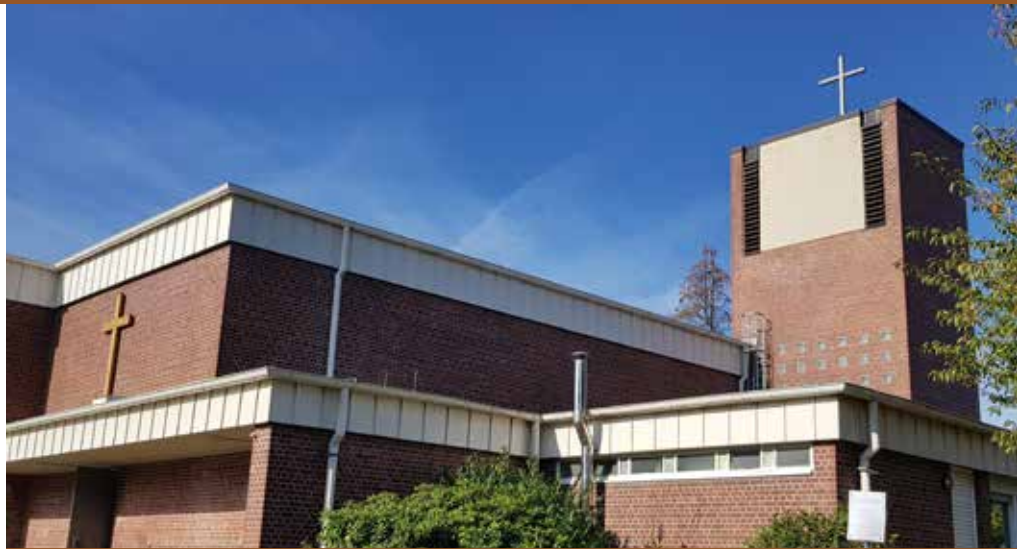
Grundsteinlegung 26. Mai 1968

„Schuhschachtel“ oder gar „Müllheizkraftwerk“: Das sind nur zwei der liebevollen Spitznamen für die Kirche St. Peter und Paul in Kalthof. Vor fünfzig Jahren wurde der Grundstein gelegt für die Filialkirche der Gemeinde Herz-Jesu, Hennen, eine der zahlreichen Kirchen auf dem Iserlohner Stadtgebiet, die in den Jahrzehnten nach dem Zweiten Weltkrieg erbaut wurden. St. Peter und Paul setzt in Aussehen und Funktion die Forderungen der Liturgiereform nach einem neuen Verständnis von Gemeinde und Gottesdienst in einzigartiger Weise um.