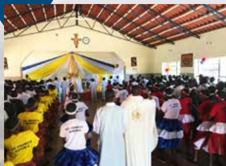
Messe in der St. Francis School.

Nachdem ich Tee getrunken und mich fertig gemacht habe, mache ich mich auf den drei km langen Weg durch den Busch zur Lari Primary School, wo ich am Unterricht der 2. Klasse teilnehmen und manchmal sogar Mathe unterrichten darf. Um 1 Uhr ist Mittagspause und die Schüler, die es nicht weit bis nach Hause haben, gehen zum Essen heim. Wir holen ein Kind vom Kindergarten ab und gehen dann die 500 Meter weiter ins Small Home.